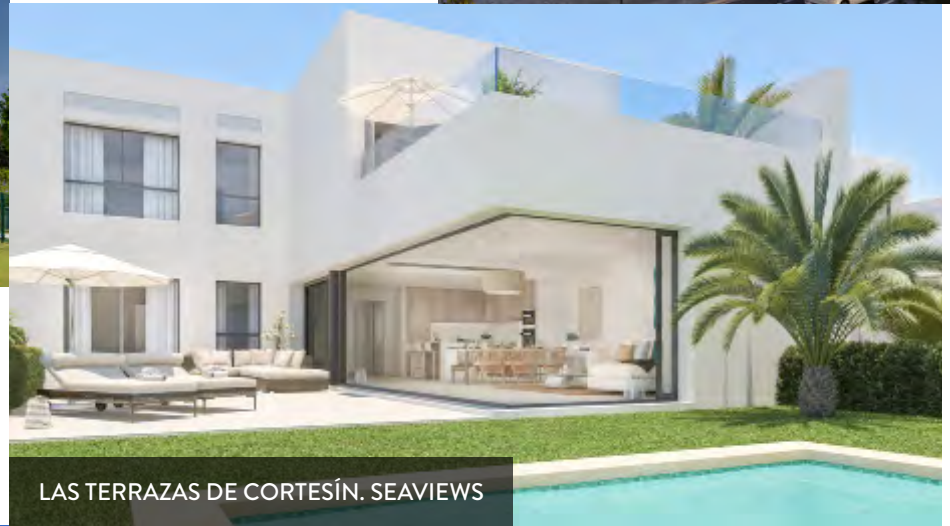
LAS TERRAZAS DE CORTESÍN. SEAVIEWS